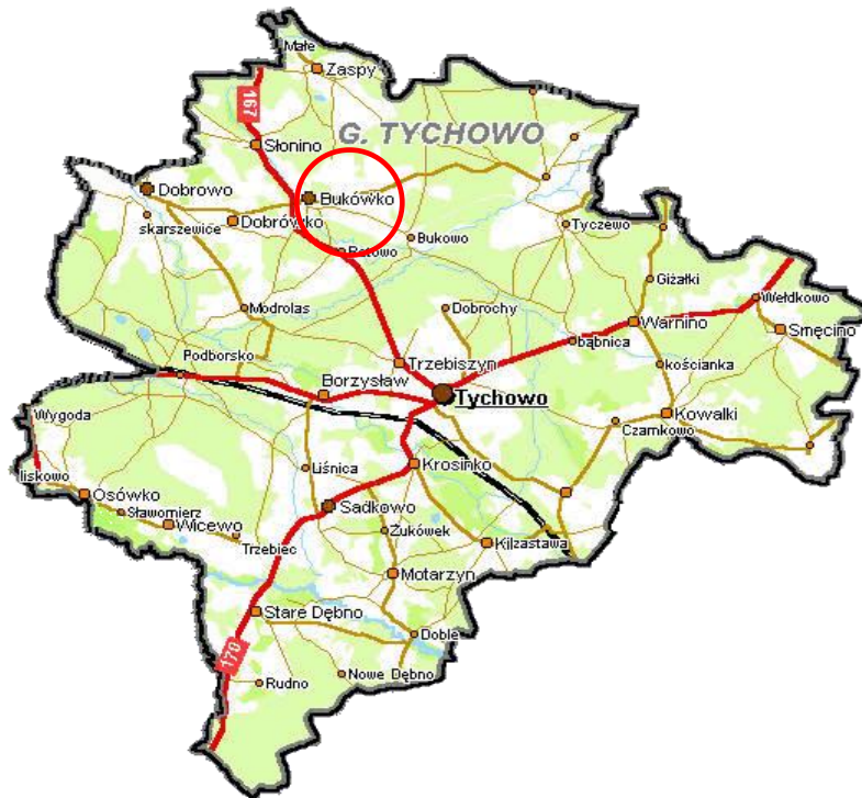
Rysunek Nr 1. Położenie miejscowości w gminie.